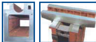
Vista della struttura della colonna, del basamento e del sottotavola View of column, bed and saddle