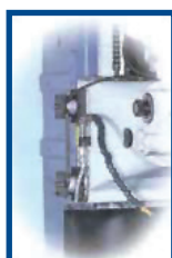
Bloccaggio automatico asse Z (optional) Brake cylinder