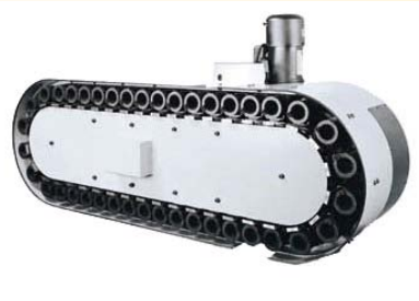
Cambio utensili automatico 40 postazioni ATC ARM 40 Tools