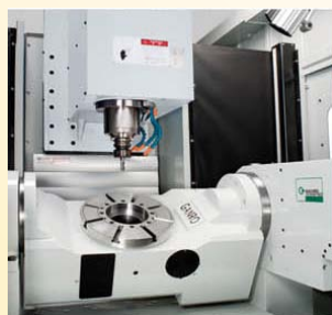
Tavola roto-basculante Rotary-Tilting table C 360° / A-15°~+115°