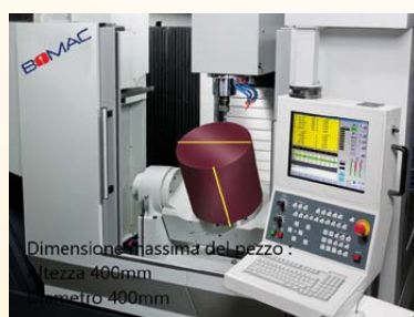
Dimensione massima del pezzo - Altezza 400mm Larghezza 400mm